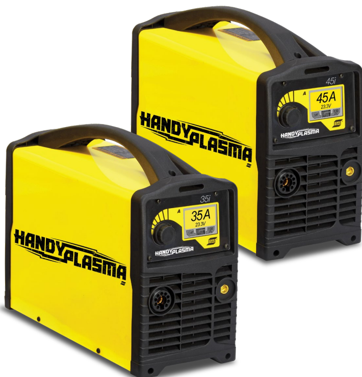
HandyPlasma 35i / 45i